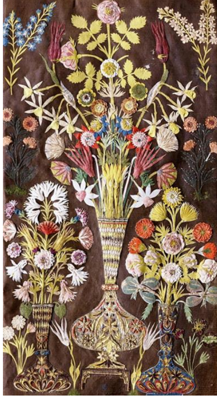
Fotoğraf 12. Mehmed Selim Dîvânî, AVEM, Oyma vazolu sayfa, 3a (İrepoğlu, 2014: 117).