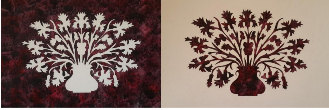
Fotoğraf 4. Oyulmuş dişi kalıp ve oyularak çıkartılan erkek kalıp (Eryılmaz, 2022).