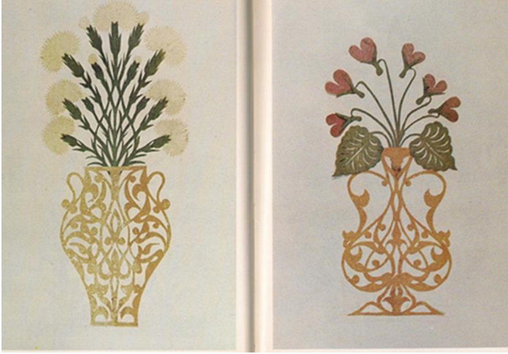
Fotoğraf 10. Kıyafet Albümü, Bibliotheque Nationale BnF Od 26, 15x8.5 cm (Ünver ve Mesara, 1980).

Albümündeki oymalara benzer şekilde, muhtemelen çarşı ressamı tarafından yapılan bu eser, bu albümdeki oymalarda yalın kat ve sade çalışma ile ince işçilikten uzak ve az renklidir. Ancak, kati' sanatında göze çarpan sade güzellik, Türk zevkini, motif ve renk çeşitliliğinin belirgin bir örneği olması açısından önem taşımaktadır (Mesara, 1991: 21). Uzun ve dar boyunlu saksı biçimindeki iri yayvan vazoların üstlerine, ince ve grift motifli oyma bezemeler yapılmıştır ve albümde bitki, çiçek ve vazo tasvirleri dışında da farklı tasvirler yer almaktadır (Demiriz, 2019: 92), (Fotoğraf 10).