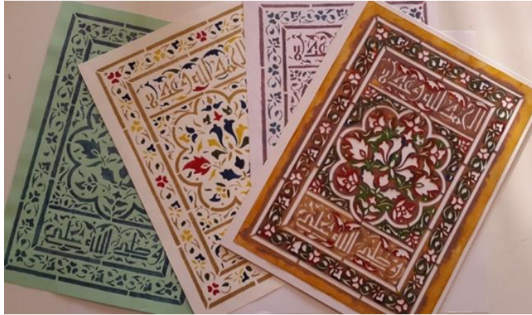
Fotoğraf 5. Kaside-i Bürde, SK, Ayasofya 4170 no'lu Yazma Eser İçinde Dişi Oyma Sayfa reproduksiyonu, Dişi kalıpla yapılmış boyama örnekleri.

Oyma kalıplarda görülen desenlerin çoğu bitkiselidir. Avrupa'daki kitaplarda cami, köşk ve çintemani gibi tasvir ve motifler de bulunmaktadır. Ayrıca rumi kompozisyonlar ile hatayı türündeki ileri derecede stilize çiçeklere de çokça rastlanır. Çiçek tasvirleri arasında otlar ve kır çiçekleri görülmektedir. Özellikle 16. yüzyılın en önemli sanatkarlarından müzehhip Kara Memi'nin geliştirdiği natüralist üsluptaki çiçekler, bu dalın en başta gelen örnekleri arasında yer almıştır. Kara Memi'nin yaşadığı dönemden yüzyıllar sonra bile bu büyük üstadın tarzındaki laleler, sümbüller, güller ve diğer çiçekler oyma sanatının en gözde motifleri olarak hemen her örneğinde ve bilhassa kalıp desenlerinde sulu altın ve hafif renklerle halkar tarzında kullanılmıştır (Mesara, 1998: 47). Süsleme sanatlarında sıkça başvurulan bir teknik olarak, kalıptan püskürtme veya boyama usulü ile kitap sayfalarının cetvel dışında kalan kısımlarını bezeme tekniği olarak, özellikle 16. yüzyıla ait el yazmalarında çok yaygın bir biçimde kullanılmıştır. Kendi dönemlerinde kati' sanatkarları tarafından çok çeşitli motiflerle yapılan dişi oyma kalıplardan ortaya çıkan desenler, genel olarak sanat değeri yüksek olmayan kabaca süslemeler olarak görülse de, tüm motifler aslında dönemlerinin tezyini esaslarına uygun karakterler taşımaktadır (Mesara, 1998: 45), (Fotoğraf: 5).