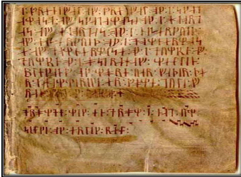
Resim 2. 'Drømde mik en drøm i nat' 4

Müzik, Latin alfabesinden gelen harflere karşılık gelen rünlerde parşömen (buzağı derisi parşömeni) üzerine yazılmıştır. Danimarka tarihini, monarşisini ve yasasını detaylandıran bir el yazması olan Codex Runicus'ta