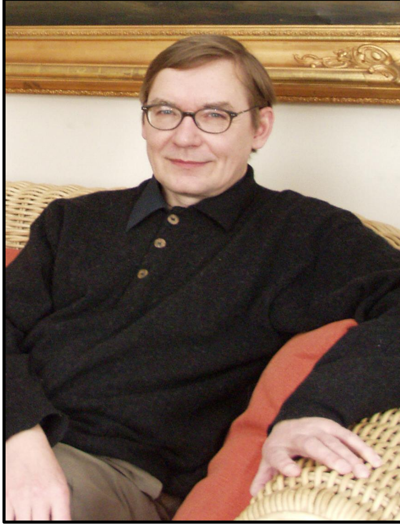
Resim 3. Kalevi Aho 6