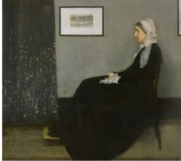
Whistler'in Annesi, 1871

Sanatçıların anne resimleri içerisinde dünyaca en meşhur olanlarından biri Whistler'in "Anne" tablosudur.