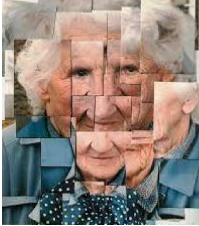
David Hockney, 1937. Sanatçının Annesi, 1986