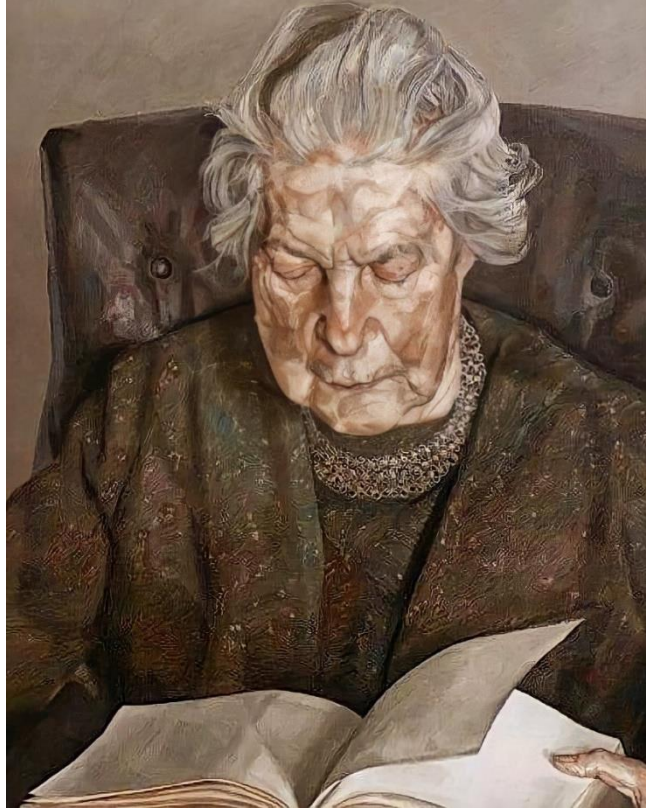
Lucian Freud (1922-2011). Sanatçının Annesi 1975