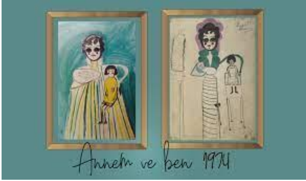
Semiha Berksoy, 1910-2004