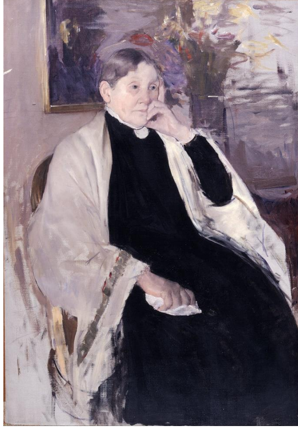
Mary Cassatt. Sanatçının Annesi, 96 x 69 cm, 1889