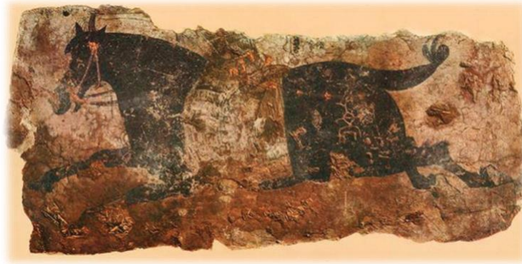
Resim 3 Kuyruğu düğümlemiş at, Uygur dönemi duvar resmi, Koço 9-10 yüzyıl (Zeren 2021:65)

At kuyruğunun saklandığı ve uğurlu olarak görüldüğü uygulamaları, devam eden tarihi süreçler içerisinde değişerek de olsa görmek mümkündür. Osmanlı dönemi de dahil olmak üzere at kuyruğunun düğümlemesi ve bağlanması çok eski bir gelenek olarak karşımıza çıkmaktadır. Çetin savaşlara girmek üzere hazırlanan ve bu yönde eğitilen alpler atlarının kuyruklarını bağlamak veya kuyrukları kesip tuğ yapmak suretiyle devlet ve millet yoluna canlarını ortaya koyduklarını ve kendilerini ölüme adadıklarını ilan ederler, diğere taraftan da bu uygulamayı uğurlu görürlerdi (Zeren 2021:65).