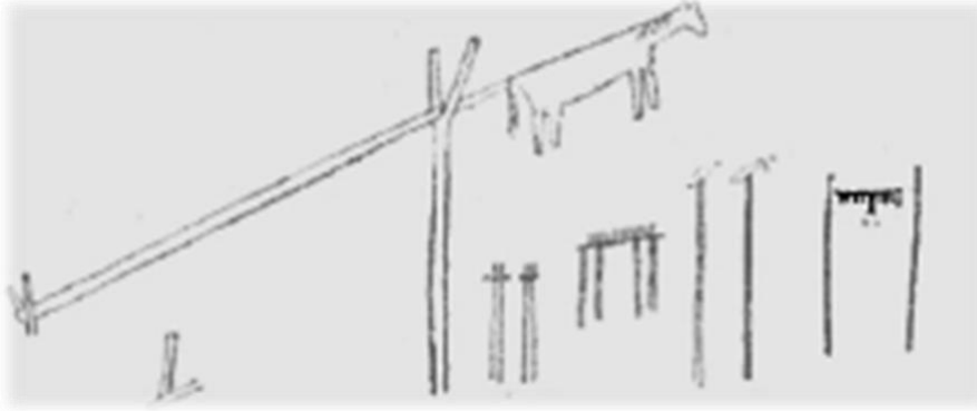
Resim-2 Altay Şaman Davulu üzerine çizilen At kurban edilme sahnesi

Bu uygulamayı, Anohin'in Altay Şamanlarının inanç içerikli materyallerine ilişkin yaptığı saha araştırmalarında elde ettiği davul üzerine yapılmış çizim görsellerinde de görmek mümkündür (Resim-2). Bu uygulamayla at kurban edilip göğre kaldırılarak, kutlu ve tanrısal hale getirildiğini söylemek yanlış olmayacaktır. Uğurlu olduğuna inanılması da kutlu ve tanrısal oluşundan ileri gelmektedir.