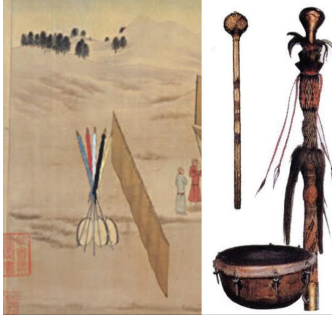
Resim 2 Hunlarda tuğ-davul takımı (solda) ve Osmanlı mehterinde tuğlu davul (sağda) (Zeren 2021:75)

Davul-Tuğ-Bayrak üçlüsü bağımsızlık sembolü olarak Osmanlı mehterlerinde de yerini korumaya devam etmiştir. Türk devletlerinde görülen at veya yak öküzü (kut-uz) kuyruklarına benzer şekilde Osmanlı ordu yapılanması, tepesinde bir demet at kuyruğu ile orta kısmında asılı küçük bir davul/tümrük bulunan tuğlar da özünde bu sembolizmin devamı niteliğindedir. At kuyruklu tuğ geleneği Osmanlı Mehterindeki çevgan adı verilen müzik aletinde de devam etmiştir (Resim 2).