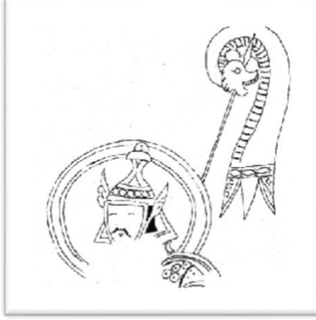
Resim 4 Kurt başlı Türk Tuğu taşıyan Alp (Zeren 2021:68)

Bu tarzdaki tuğ başlıklarına Türklerin kutsal olarak gördükleri hayvanların en önemlilerinden olan ve devlet kurmaları, yeni vatanlar bulmaları için onlara yol gösteren, liderlik yapan kurt başı figürüyle yapılan tuğları örnek olarak verilebilir (Resim 4). Bu objeler Gök-Tanrı inanışının ve kut felsefesinin maddi kültüre yansması olarak değerlendirilmelidir (Ögel 1971:144; Zeren 2021:68).