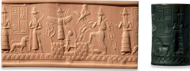
Şekil 8: Adda Silindir Mührü, Akad İmparatorluğu

Mezopotamya sanatında silindir mührerler ve seramik ve taş kaplar küçük el sanatları olarak değerlendirilebilen üretimler arasındadır. "Silindir mührerler mülk damgaları, işaretli muskalar ve nazarlıklardır" (Turani, 2012: 84). Silindir mührerlerde güneş ve ay motiflerine oldukça sık rastlanılmaktadır. "Silindir mührerde Mısır hiyografik yazılarda görülen bazı figürler de mevcuttur. Bu figürleri başka taş mührerlerde de görmek mümkündür. Bazen bir canlının, bir insanın parçası, bazen de bağımsız olarak kullanılmıştır" (İnanç, 2017: 59; Koçak, 1996: 15-16).