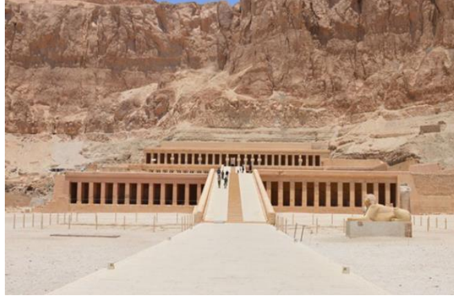
Şekil 1: Hatşepsut Tapınağı

yerleştirilmesine baktığımızda özel bir sıralamanın olmadığı dikkat çekicidir. Ortak ve değişmeyen şey ise taşlarla çevrili ve dikdörtgen biçimli kral odalarıdır. Piramitlerin dış cepheleri genellikle beyaz kireç taşından kaplanmıştır. Orta imparatorluk döneminde yapılan piramitlerde genellikle çıkış rampaları bulunmaktadır. "Birbiriyle ilişkili bina öğeleri, geleneksel olarak kullanılan Mısır mimarisi öğeleridir: Kutsal yol, filpayeli avlu, piramit" (Turani, 2012: 50).