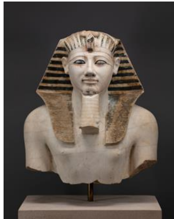
Şekil 5: III. Tutmosis Heykelinin üst kısmı, Sertleşmiş kireçtaşı, Yükseklik 42.6 cm, Yeni Krallık Dönemi, 18. Sülale

Mısır heykel sanatı örneklerine tapınaklarda rastlanılmaktadır. Mısır heykelleri genellikle tanrıları tasvir etmektedir. Amarna Çağında ( İ.Ö. 1377-1358) Aton adında yeni bir din ortaya çıkmıştır. Bu dinin özellikle heykel sanatını etkilediği bilinmektedir. Orta imparatorluk çağında heykeller giyinik betimlenmektedir. Erkeksi görünüş burada önemlidir, kadınlar bile erkek biçimine yakın belirtilmiştir. Eski İmparatorluğun sonunda, betimlenen firavun heykellerinde yorgunluk ve tevekkül ifadesi gözlemlenebilmektedir. Bu durum bize Mısır tarihinin karanlık dönemlerinin başlangıcını ifade etmektedir. Sfenks heykelleri de Mısır sanatı için oldukça önemli bir konumdadır (Turani, 2012: 63). Yeni imparatorlukta karşılaşılan heykellerde de orta imparatorluk sanatına benzer bir üslup benimsendiği görülmektedir. Bu dönemde yapılan heykeller mısır sanatının belki de en incelikle işlenen heykel örneklerini vermiştir. Cepheden duruş katılığı terk edilmeye başlanmıştır. Natüralist bir tavır belirgindir.