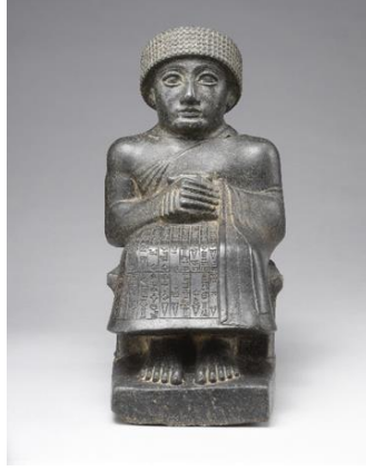
Şekil 6: Kral Gudea

Mezopotamya heykel sanatı, coğrafi bölgenin özelliklerine ve farklı dönemlere göre oldukça farklı özellikler göstermiştir. Mezopotamya’da rastlanan heykellerde özellikle kaş ve burunun ön plana çıkarıldığı yüzün ise daha sadeleştirildiği, birçoğunda ağzın bulunmadığı görülmektedir. Tam bir portre anlayışı henüz oluşmamıştır. Kollar vücuda yapışık, bacaklar birbirinden ayrılmamıştır ve boyun mevcut değildir (İnanç, 2017: 11; Bodreuil vd, age: 440-441). Mezopotamya heykel sanatının tarihi, M.Ö. ± III. binden daha eskiye dayanmaktadır. Ur, Uruk ve Lagaş kent harabelerinde çeşitli heykel ve kabartmalar ortaya çıkarılmıştır. Heykellerin bir çoğunluğu altın ya da gümüşten yapılmıştır. Ayrıca asfalt veya zift üzerine sedef kakma işler yapıldığı da görülmektedir (İnanç, 2017: 21).