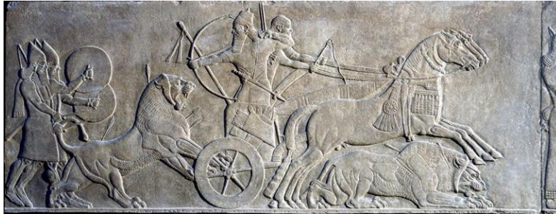
Şekil 4: Ashurnasirpal III Aslan Avı

Ayrıca Mezopotamya sanatında pano üzerine yapılan resim ve rölyef örnekleri de oldukça dikkat çekicidir. İlkinii II. Asurnasirpal'ın yaptırdığı bu levhalar sanatın propaganda aracı olarak kullanılmasına bir örnek olarak gösterilmektedir. "Tamamen siyasal propagandaya yönelik bu görkemli levhalar kralın ve devletin başarılarını anlatan bir tür reklam panosu görünümündedir" (İnanç, 2017: 129; Gökçek, age: 270).