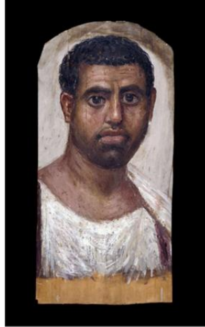
Şekil 3: Fayyum Portresi

Belki de Mısır sanatının en ilginç örneklerinden biri de Fayyum portreleridir. Onları bu denli ilginç ve özel kılan şey Mısır sanatının diğer örneklerine hiç benzemiyor oluşları ve çok gerçekçi bir üslupla betimlenmiş olmalarıdır. Portrelerin yarattığı duygusal etki oldukça güçlüdür. Söz konusu bu portrelerin Klasik Mısır sanatından bu denli farklı oluşunun nedeni ise Grek etkisidir. Savaş sırasında Mısır'a gelen Grek askerleri ülkelerine dönmek yerine Mısır'a yerleşmişlerdir. Ve böylece kendi kültürlerini de bu bölgeye getirmişleridir. Bu dönemden sonra Grek etkisi her alanda kendini oldukça belli etmiştir. Bu portreler aslında