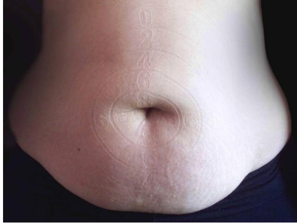
Resim 2. Özgül Kahraman, Hedef(siz) , beden üzerine kaşe baskı, 2016

Bedensel tüketim toplumlarının hem tüketen hem de tüketen öğeleri arasında neredeyse ilk sırada yer almaktadır. İhtiyaç fazlası üretim yapan tekstil sektörü, arzuların, doyumsuz bedenler ararken, spor, diyet, kozmetik, estetik cerrahi gibi alanlar ise görüntüsünden memnun olmayan bedenlere ihtiyaç duymaktadır. Bedeni düzenlemeye yönelik müdahalelerin bir göstergesi olarak tasarlanan Hedef(siz) (Resim 2), hasarlı olarak ifşa edilen bedenin hedef alınmasına odaklanmaktadır. Estetik cerrahi her geçen gün bedeni güzelleştirmeye yönelik yeni bir buluşla tüketicisine hizmet sunmaktadır. Yeni bir yöntemi tanıtırken, yöntemin uygulanacağı alanın mevcut halini farkında olarak/olmayarak hasarlı olduğunu ima eden söylemlerde bulunmaktadır. Bu durum bireyde bir yandan bedeninden memnuniyetsiz olma hali yaratırken öte yandan güdümlendiği görüntüye ulaşmak için karşı konulmaz bir arzu beslemektedir. Bedenin mükemmel görüntüye bir an önce ulaşması yönündeki çeşitli uyarılarla -ki bunların büyük oranını teknoloji destekli kitle iletişim araçları, reklamlar oluşturmaktadır- bireye empoze edilmektedir. Diyet, estetik gibi alanlar geliştirdikleri yeni yöntemleri denemek üzere bireylere hasarlı olarak dikte ettikleri bedenleri onarmak üzere hazır vaziyette beklemektedir. Arzu edilen/ettirilen görünüme kavuşturma elçileri olarak görev yapmaktadırlar.