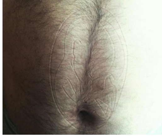
Resim 3. Özgül Kahraman, Bir Garip Sancı , beden üzerine kaşe baskı, 2016