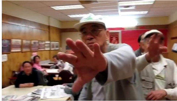
Resim 7. Surveillance Camera Man, video kaydı, 2018

Gözetlemenin hem amacı hem de sonucu olarak, kontrol altına alınan beden, iktidar ve tüketim araçlarının etkisiyle yeniden şekillenmektedir.