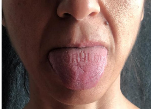
Resim 6. Özgül Kahraman, Görülüyorum, O Halde Varım , dil üzerine kaşe baskı, 2019

Çağdaş beden Panoptik düzende yaşamını sürmeyi kabullenmiş durumdadır. Dört bir yanı kuşatan kameralar, sabitlendiği yerden sessizce günlük yaşamın içine derinlemesine nüfuz etmekte ve varlığını hissettirmeden toplumu kayıt altına almaktadır. Görülüyorum, O Halde Varım (Resim 6) adlı çalışma gözetlenmenin yaşama yansımalarını ironik bir anlatımla ele almaktadır.