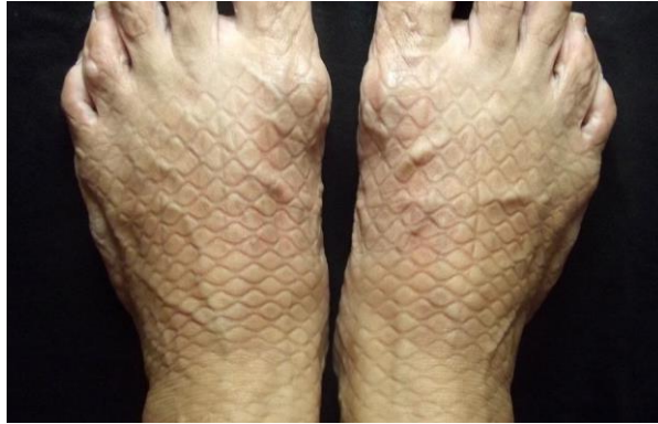
Resim 4. Özgül Kahraman, Hakiki Deri II , beden üzerine kaşe baskı, 2019