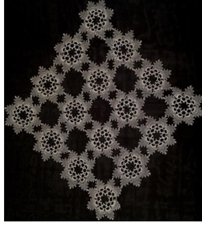
Resim 1. Emine Yıldırım'a ait iğne oyası sehpa örtüsü Resim 2. Zehra Yılmaz'a ait iğne oyası sehpa örtüsü