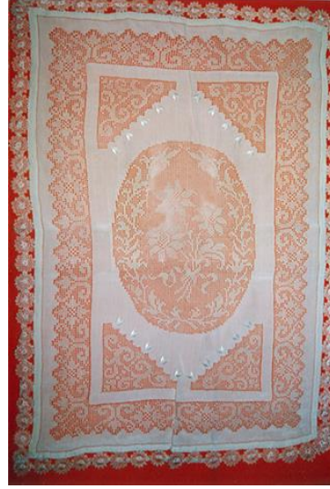
Resim 3. Selma Aslan'a ait iğne oyalı Antep işi sehpa örtüsü Resim 4. Özşen Turan'a ait iğne oyalı Antep işi sehpa örtüsü