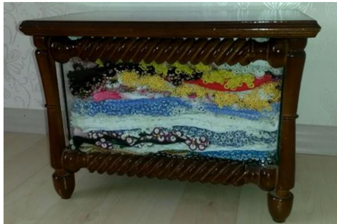
Resim 15. Zehra Deveci'ye ait (camekan) yazma sandığı

Gaziantep ili Nizip ilçesinde bir genç kızın çeyizinde en az 30- 40 adet oyalı yazma bulunmaktadır. Bu yazmalar dört kenarı camlı bir biçimde yapılan, "yazma sandığı" veya "camekan" denilen, küçük sandıklar içerisinde saklanmaktadır. Geçmişte hemen her genç kızın çeyizinde bulunan bu sandıklar, günümüzde yörede yaygınlığını yitirmiştir.