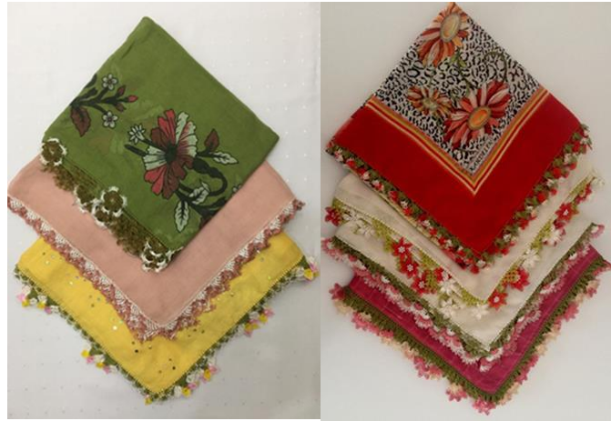
Resim 5. Nesibe Doğan'a ait iğne oyalı yazma örnekleri Resim 6. Necmiye Kara'ya ait iğne oyalı yazma örnekleri