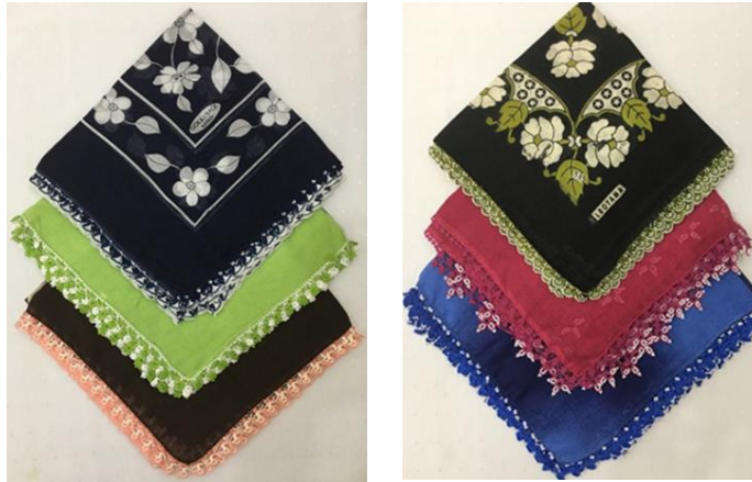
Resim 9. Yüksel Bahçeci'ye ait tığ ve mekik oyalı yazma örnekleri Resim 10. Fatoş Eser'e ait boncuk oyalı yazma örnekleri

Nizip ilçesinde boncuk oyalı yazmalar genellikle tülbent ismi verilen beyaz başörtülerinin kenarlarına uygulanırken, araştırmalar sırasında renkli yazmaların kenarlarına uygulanan örneklerine de rastlanmıştır.