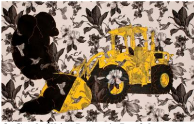
Resim 8. Gözde İlkin, Domestic Deed , kumaş üzerine boya ve dikiş, 2011

üretildiği alanın önemli ve ayırıcı argümanlarıdır. Batı düşüncesinde toplum doğa ilişkisini açıklamaya yönelik üç ana yaklaşım vardır: teknomerkezci, ekomerkezci ve toplumsal. İlk ikisi düalist bir açıdan, doğayı dışsal ve evrensel görür. Bu düalizm çevre iktisadının teknomerkezçiliğinde olduğu gibi yeşillerin radikal ekomerkezçiliğinde bulunur. Teknomerkezçilik araçsal aklı önceye alır ve doğanın kontrolünü insan mutluluğunun bir aracı olarak görür. Bunun aksine ekomerkezçilik insanlığa değil doğaya öncelik verir. Fakat üçüncü bir yaklaşım, doğanın toplumsal üretimi yaklaşımının bu iki yaklaşıma karşı ayırıcı üstünlükleri vardır. Bu yaklaşım toplum (kapitalizm) ve doğa arasında ontolojik bir ayrımı reddeder, kapitalist bir dünyada doğanın artık doğal olmadığını, söylemsel (ideolojik) ve maddi düzeyde sermaye birikimi hizmetinde üretildiğini ve çevresel sorunların ve bunların çözümünün ancak kapitalist ekonomi politüğün gerçekliklerinin anlaşılması sayesinde açıklanabileceğini ileri sürer" (Özberk, 2017: 76)".