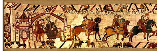
Resim 1. Bayeux Gobleni'nden ayrıntı, kumaş üzerine nakış işleme, 1077 dolayları

Bu ayrıma rağmen Ortaçağ'da iğne ve ipliğe dayalı eserler, tuval resmi ile eşit bir değere sahip olmuştur ki bu anlayışın en nadide örneklerinden biri Bayeux Gobleni'dir. 1077 yılına dayanan bu nakış; Romanesk dönemine dayanan en nadide eserlerinden biri olarak kabul edilir. Norman güçlerinin İngiltere'yi işgal sürecinin aktarıldığı çoğunlukla askeri güçlerin ve atların yer aldığı bu goblen; boyutları, konu zenginliği ve sunum tercihleri açısından dönem eserlerine göre ayrı bir değer taşımaktadırlar. 1066 yılındaki Hasting Muharebesi gibi önemli tarihi bir olayın görsel kayıt altına alınması için nakış formunda bir eserin sipariş edilmesi, o dönem için tuval resmine karşı nakışın üstünlüğü olarak da okunabilir.