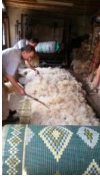
Fotoğraf 5. Hasır üzerine yünün atılması - Erkuş Keçe Atölyesi - Afyonkarahisar

- Yün hasır üzerine atılır (Fotoğraf 5).