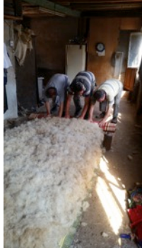
Fotoğraf 6. Yünün hasırla birlikte sarılması - Erkuş Keçe Atölyesi - Afyonkarahisar

- Yün hasırla birlikte sarılır (Fotoğraf 6).