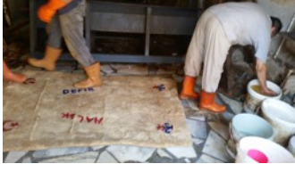
Fotoğraf 11. Yünün üzerine sabunlu su serpilmesi - Erkuş Keçe Atölyesi - Afyonkarahisar

- Kenarları düzeltildikten sonra üzerine sabunlu su serpilir (Fotoğraf 11).