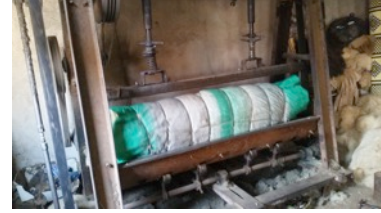
Fotoğraf 9. Hasıra sarılan yünün tepme makinesinde dövülmesi - Erkuş Keçe Atölyesi - Afyonkarahisar

- Hasıra sarılan yün tepme makinesinde dövülür (Fotoğraf 9).