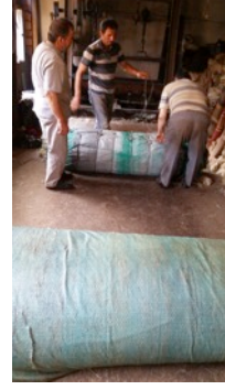
Fotoğraf 8. Sarılan hasırın halat ile sıkıca bağlanması - Erkuş Keçe Atölyesi - Afyonkarahisar

- Sarılan hasır halat ile sıkıca bağlanır (Fotoğraf 8).