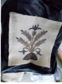
Fotoğraf 17. Atölyede yapılan paspas örneği - Erkuş Keçe Atölyesi - Afyonkarahisar