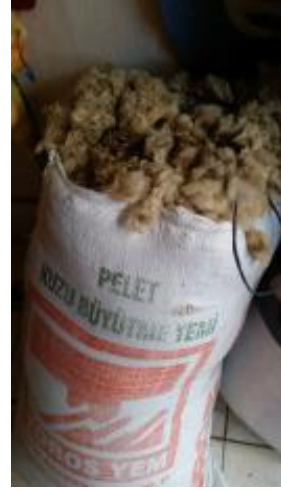
Fotoğraf 2. Keçe yapımında kullanılan yün (ham madde) - Erkuş Keçe Atölyesi - Afyonkarahisar

- Yün, tarak makinesinden geçirilir (Fotoğraf 3 ve 4).