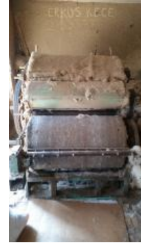
Fotoğraf 3. Tarak makinesinden geçirilme işlemi – Erkuş Keçe Atölyesi - Afyonkarahisar

- Yün, tarak makinesinden geçirilir (Fotoğraf 3 ve 4).