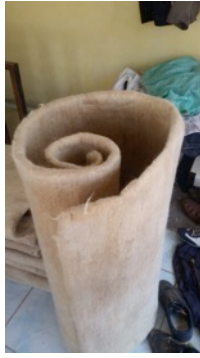
Fotoğraf 18. Tek kişilik yatak - Erkuş Keçe Atölyesi - Afyonkarahisar