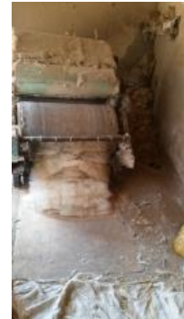
Fotoğraf 4. Tarak makinesinden geçirilmiş yün – Erkuş Keçe Atölyesi - Afyonkarahisar