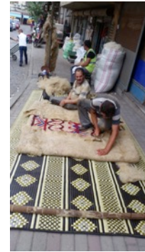
Fotoğraf 10. Keçeleşen yünün açılıp kenarlarının düzeltilmesi - Erkuş Keçe Atölyesi - Afyonkarahisar

- Keçeleşen yün açılıp kenarları düzeltilir ve tekrar tepme makinesinde tepilir (Fotoğraf 10).