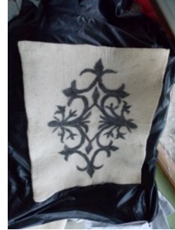
Fotoğraf 16. Atölyede yapılan paspas örneği - Erkuş Keçe Atölyesi - Afyonkarahisar

-Yıkanan keçeler kurutulur (Fotoğraf 14 ve 15).