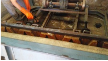
Fotoğraf 12. Sulanan ve sabunlanan keçenin pişirilmesi - Erkuş Keçe Atölyesi - Afyonkarahisar

- Pişirme işleminden sonra keçe yıkanıp, arındırılır (Fotoğraf 13).