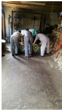
Fotoğraf 7. Sarıldıktan sonra birkaç kez yuvarlanan yün - Erkuş Keçe Atölyesi - Afyonkarahisar

- Sarıldıktan sonra birkaç kez yuvarlanır (Fotoğraf 7).