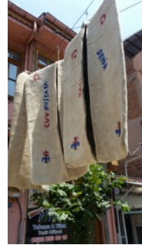
Fotoğraf 15. Yıkanan keçelerin kurutulması - Erkuş Keçe Atölyesi - Afyonkarahisar