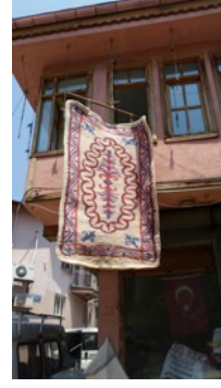
Fotoğraf 14. Yıkanan keçelerin kurutulması - Erkuş Keçe Atölyesi - Afyonkarahisar