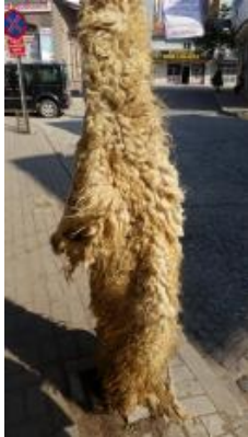
Fotoğraf 1. Keçe yapımında kullanılan yün (ham madde) – Erkuş Keçe Atölyesi - Afyonkarahisar

- Keçe yapmak için öncelikle yün (ham madde) temin edilir (Fotoğraf 1 ve 2).