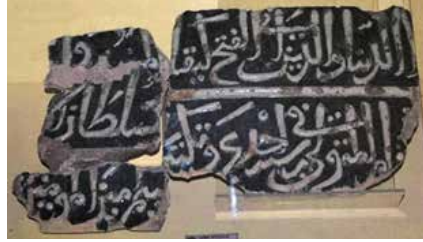
Resim-5: Sahip Ata Vakıf Müzesi, mescidin mihrabından çıkan çini parçalar

Mescidin mihrabında bulunan çini parçalar günümüzde Konya Sahip Ata Vakıf Müzesinde teşhir edilmektedir (Resim-5). Farklı ebatlarda olan kırık çini parçaların ölçüleri sol üstten sırayla; 20x11cm; 20x17,5cm; 24,5x10cm; 46x37,5cm'dir. Zemini lacivert kabarık harfleri beyazla sırlanan bu çiniler müzede 187, 188, 189 ve 190 envanter numarası ile sergilenmektedir. Ancak müze envanter bilgilerinde çinilerin bulunduğu yerle ilgili yanlış bilgilendirme yapılarak Beyşehir Eşrefoğlu Camii ve Türbesi yazmaktadır.