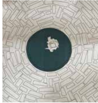
Çizim-4: Mescit kubbe içi çini çizimi (Konya Kültür Varlıklarını Koruma Bölge Kurulu Müdürlüğü arşivi)