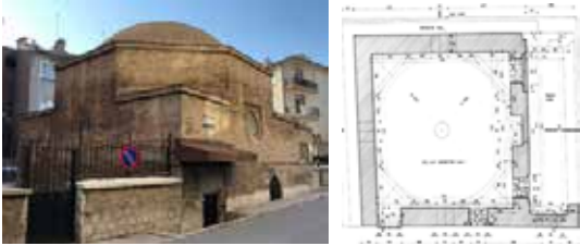
Resim-1: Mescit genel görünüm, 2019

İç Karaaslan Mescidi Konya ili Karatay ilçesi Şems Tebrizi Mahallesindedir (Resim-1). Mescit Ziyaeddin Kara Arslan tarafından Selçuklu döneminde 13. yüzyılın ilk yarısında yaptırılmıştır (Küçükdağ ve Arabacı, 1994: 258). Yapım malzemesi olarak tuğla, kesme ve moloz taş görülmektedir. Karaaslan mescidi kare planlı olup üzeri kubbe ile örtülmüştür. Kubbenin kurşun ile kaplanmış olduğu görülmektedir. Dıştan 9,5x11,64 m ölçülerinde dikdörtgen bir alanı kaplayan mescidin güneyine sonradan ilave edilmiş türbesi bulunmaktadır (Çaycı, 2012: 320). Mescidin kubbesi sekizgen kasağa oturmaktadır. Eserin sivri kemerli küçük pencereleri bulunmaktadır. Harimin kible tarafında altta iki, batıda bir; üst kısımlarda ise; batıda bir kuzeyde duvarda bir ve kubbe kasağında dikdörtgen formlu bir pencere bulunmaktadır (Karpuz, 2009:176). Mescide kuzey doğuda bulunan kapıdan girilmektedir (Çizim-1).