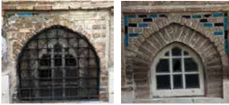
Resim-9: Mescidin batı ve güney cephesindeki pencere alınlık çinileri

Mescidin güney, doğu ve kuzey cephesinde tuğladan yapılmış sivri kemerli pencereler mevcuttur. Batı ve güney cephedeki pencere alınlıklarında tek renk firuze ve lacivert sırlı tuğlalar görülmektedir (Resim-9). Sırlı tuğlaların ebatlarını incelediğimizde enleri; 4 cm, boyları; 4,10,12,16,22 cm olarak değişkenlik göstermektedir (Çizim-3).