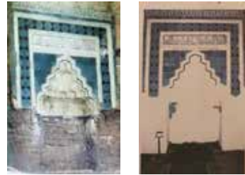
Resim-6: (Solda) Onarım öncesi mihrap görünümü, 1991.

Vakıflar Genel Müdürlüğü tarafından hazırlanan ve Konya Kültür Varlıklarını Koruma Bölge Kurulunun 1991 senesinde uygun bulunan restorasyon projesi kapsamında, mihrabın alt kısmındaki dökülen çinilerin yerine alçı sıvama yapılmasına 2006 senesinde karar verilmiştir (Resim-6-7).