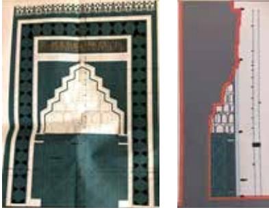
Çizim-2: Mihrap çizimi (Konya Kültür Varlıklarını Koruma Bölge Kurulu Müdürlüğü arşivi)

Konya Kültür Varlıklarını Koruma Bölge Kurulu Müdürlüğü arşiv belgelerinde 1990 senesinde mihrapta yapılan onarımlar fotoğraflarla belgelemiştir. Bu fotoğraflardan birinde mescidin mihrabında sıva altına gömülü çini kitabe parçaları olduğu görülmektedir (Resim-3-4).