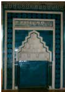
Resim-2: Mihrap, çiniler ve çini görünümlü boya uygulamaları, 2009

Dikdörtgen formlu mihrabın eni; 2.90m boyu 3.90m'dir. Alçı ve çininin bir arada kullanıldığı mihrapta; tek renk firuze sırlı kabartmalı yazılı ve kazıma mozaik teknikli çiniler uygulanmıştır (Resim-2).