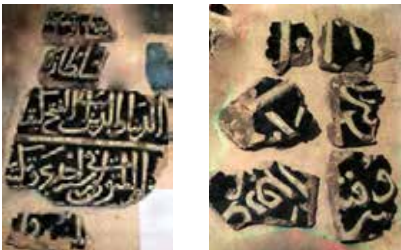
Resim-4: Kitabeye ait çini parçaları