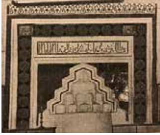
Resim-8: Mihrap (Meinecke, 1976: 37)

ların arasına yerleştirilmiş üzerlerinde "Allah" ve "Muhammed" yazılı dikdörtgen formlu plakalar görülmektedir (Resim-8). Ayrıca fotoğraftan mihrabın kavsarasında beş sıra mukarnas olduğu anlaşılmaktadır (Meinecke, 1976: 37).