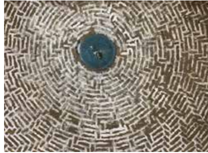
Resim-10: Mescit kubbe içi çinisi.

Konya Kültür Varlıklarını Koruma Bölge Kurulu Müdürlüğü arşivi belgesinde 2005 senesine ait fotoğrafta kubbe içi tavan göbeğinde çini olduğu belirtilmektedir. Belgelerdeki fotoğraflardan tek renk firuze sırlı plaka çini görülmektedir (Resim-10), (Çizim-4). Ancak yapmış olduğum kaynak araştırmalarında bu konuyla ilgili detaylı bilgi bulunamamıştır.