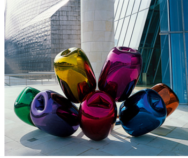
Resim 2. Jeff_Koons_Tulips_Nord_LBhttpstr. m.wikipedia. orgwikiDosyaJeff_Koons_Tulips_Nord_LB. jpg

tutum ve nesnelere bu çağa ait ekonomik, sosyal ve kültürel dokuya ait kimlik özelliklerini oluşturduğu gerçeğini ve her iki eğilimin de birbirine tezat içeriklerine rağmen kendi içlerinde olduğu kadar, çağla bütünlük ifade eden hareketler olduklarını söyleyebiliriz.