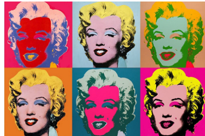
Resim 1. Andy Warhol, Marilyn Diptych https://www.google.com/search?q=Marilyn+Diptych&safe=strict&rlz=1C1CHZL_tr

Pop sanatçıların tutumu ağır eleştirilere uğrasa da vermek istediği mesajı iletme için her yolu kullanırlar. Ticaret piyasasını oluşturan tüm tarafların tutumunu takınıp, söylem, şok, etki yaratmak için her şeyi denerler ve günlük hayattan sanata aktardıkları nesnelere hem severler hem de insanların nesne tutkusunu eleştirmek için kasıtlı olarak kullanırlar. Bu nedenle de yargılanırlar: "Sömürücü uygulamalar ve bilimsel indirgemecilik, daha önce de söylendiği gibi, incelemek ve kullanmak adına gerçekliği katlederler ve her ikisi de, en azından estetik bir bakış açısına göre acımasız birer suiistimaldir". (Kuspit, 2006: 51)