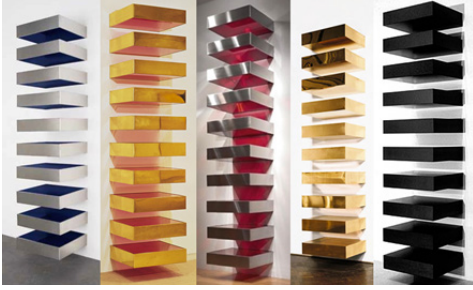
Resim 4. Donald Judd, 1969, Hirshhorn Müzesi. http://partoft-hemooc.org/wikiwp-content/uploads/201603/Slide

buldukları bir gerçeklik boyutunu nesnelleştirmişlerdir.