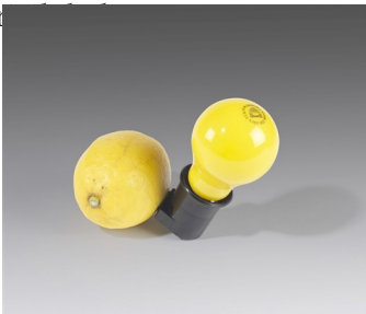
Resim 8. Capri-Batterie, Joseph Beuys, 1985.

Günümüzde Kavramsal Sanat, arazi sanatı (Land Art), yeni medya sanatı (New-Media Art), elektronik/dijital sanat, enstalasyon, süreç sanatı, performans sanatı gibi alanlarda sürdürmektedir. Tüm bu alanlarda özellikle vurgulanan unsur pentürün ve sanatın yüceliğinin biçimler üzerinden meta fetişizmine dönmesinin eleştirilmesidir. Sanat ancak fikirlerde var olur ve bu şekilde müstakil ve bir