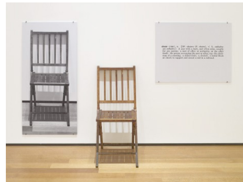
Resim 7. One and Three Chairs, Joseph Kosuth, 1965.

Kavramsal Sanat'ın temel dayanağı kendisini çevreleyen metinlerdir ve bu yanı sıra sanatın ticarileşmesine yönelik bir saldırı niteliğindedir. Bundan ötürü Kavramsal Sanat kendisinden sonra gelen tüm sanatsal hareketlere belirli oranda etkiye bulunmuştur. Dolayısıyla şu sorunun sorulabilmesi mümkündür; Kavramsal Sanat'tan sonra nasıl bir resim sanatı olmalıdır? Kavramsal Sanat'ın teorisyenlerinin başında gelen Kosuth'un resim sanatına ilişkin çeşitli düşünceleri söz konusudur. Bunları toplu halde, "Felsefeden Sonra Sanat" makalesinde Kosuth; " bugün sanatçı olmak sanatın doğasını sorgulamaktır. İnsan resmin doğasını sorguladığında, sanatın doğasını sorgulamış olmaz.. Bu nedenle sanat sözcüğü genel, resim sözcüğü ise özeldir. Resim bir tür sanattır. Resim yaparsanız sanatın doğasını sorgulamış olmaz, kabul etmiş olursunuz " demektedir. (Kosuth, 1991: 28)