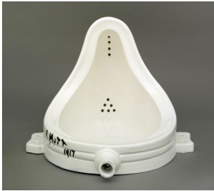
Resim 2. Fontain, Marcel Duchamp, 1917.

Kosuth'un Duchamp'a verdiği referans Kavramsal Sanat'ın öncüllerinden biri olarak Dadaizm'i ön plana çıkartmaktadır. Dadaizm, 1916-1917 yıllarında New York ve Zürih merkezli olmak üzere ortaya çıkan yeni bir sanat hareketidir. ( Kosuth, 1991: 17) Bu hareketin temel düsturu, artık sanatsal anlamda yeni bir şey üretilemeyecek olması ve bu nedenle sanata karşı inançsızlık ve onu yok etme motivasyonudur. Bu aşamada Marcel Duchamp, hazır-yapımları (ready-made) ile ön plana çıkmaktadır. Sanat ürününün yüceliğini, tekilliğini vurgulayan eğilime karşın Duchamp, bir pisuarı sanat eseri olarak gündeme getirerek bu estetik çerçeveye itiraz etmektedir.