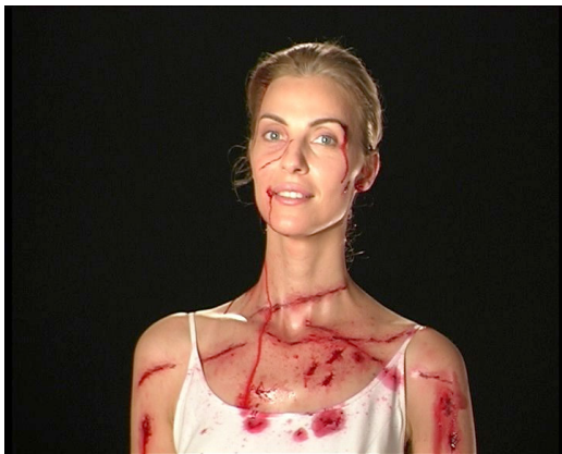
Resim 6. "I Am Milica Tomic", Milica Tomic, 1998.

Resmin gelenekselliği terk etmesi eğiliminin en temel sonuçlarından biri olarak Body-Art gelmektedir. 1960'ların sonlarından itibaren gözlemlenmeye başlanan Body-Art, sanatçının bizatihi kendi bedenini doğrudan ya da dolaylı (video-fotoğraf vb) ile kaydetmesi ve beden gücü ile performansını kullanarak süreci resmetmesi olarak ön plana çıkmaktadır (Günay, 2005: 49)