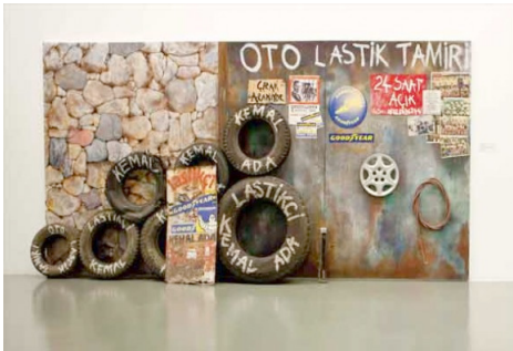
Resim 5. Kent Duvarlarının Yarım Yüzyılı, Burhan Doğançay, 2012.

Sarkis'in "Bir Kilometre Taşı" isimli 2005 tarihli sergisi de Akbank Sanat Galerisi'nin tüm katlarına işlevsellik katmayı içermesiyle sanatın artık sadece bir tuvale ya da taşa hapsolamayacağını kanıtlayan örneklerdir (Günay, 2005:45). Bu anlamda eser artık tamamlanmış ve müzeye kaldırılmış bir ürün değil, performe edilen ve süreç içerisinde şekillenen, tam anlamı ile bütünlenmemiş ve zaten hiç bütünlenmeyecek olan bir eylemlilik halindedir. Pentüre karşı çıkan bir diğer ressam ise Burhan Doğançay'dır. Doğançay'ın yarattığı gerçeklik Pop-Art nesnelerin, gündelik yaşama dair unsurların sanatın yüksek estetik iddiasını reddederek hayatın içerisine girmesi ve bu şekilde bir sanatsal gerçeklik üretmesinden geçmektedir.