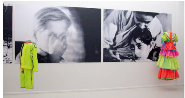
Resim 4. Bir Kilometre Taşı, Sarkis, 2005.

Günümüz resim sanatı değerlendirilirken özellikle post-modernizmin temaları önemli bir rol oynamaktadır. Post-modernist sanatta sanatçının üstünlüğü kaldırılmış ve sanat ürünü ön plana çıkartılmıştır. Özellikle Joseph Beuys'un sanatın hayatın her alanında olduğunu vurgulayan çalışmaları, dönüştürücü nitelikte olmuştur. İnsanların hepsi istedikleri takdirde birer sanatçıdır. Türkiye'de ise kavramsal sanat çalışmalarının başlangıç tarihi olarak 22 Mart-5 Nisan 1980'de gerçekleştirilen, "Sanat Tanıtımı Topluluğu Eğitimi" gösterilmektedir. İstanbul Devlet Güzel Sanatlar Akademisi'nde gerçekleştirilen etkinliğe ait parçalar ortak bir yaklaşımla kategorize edilmiş ve galeri ortamına yerleştirilmiştir. Bu etkinlik aynı zamanda ülkemizdeki ilk enstalasyon çalışmalarını içermektedir. Nitekim bu çalışmayı izleyen süreçte, "Sanat Olarak Betik" isimli yayın gerçekleştirilmiştir. Bu yayında Şükrü Aysan'ın, Joseph Kosut'un metinleri bulunmaktadır (STT, 2017:21). Ülkemizde Kavramsal Sanat, post-modernist sanat eğilimleri içerisinde gözlemlenen tüm örneklerde irili ufaklı şekillerde hissedilebilmektedir. Bedri Baykam'ın, Kutluğ Ataman'ın, Erinc Seymen'in çalışmaları artık pentürün bilinen anlamda salt sanat olarak varlığını korumasının önündeki engelleri de göstermektedir.