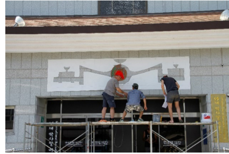
Görüntü 3: Panonun montajına başlama

Fırın inşasında yaşadığımız birlikteliğin getirdiği başarı, bizim hikâyemizi yazmıştı zaten! Anamlı ve amaçlı buluşma, akıl dolu hesap ve mutlu son... Bu birikimle yanımda getirdiğim en değerlilerimle yola çıkmış ve iyi olacağına inandığım bir sonla bitecekti... Bitti de... Keyifle ve bilinçli birliktelikle, benden birçok şeyin yer aldığı, cesaretimin, bakış açımın, dile dökmek istediklerimin, mesajımın izleriydi onlar... Ve çalışma böyle sonuçlanmıştı...Elbette benden birçok şey barındırıyordu. Tazım vardı. Hayatı okuma biçimim bana özgüydü. Beni temsil ediyordu. Zaten öyle de olması gerekiyordu. Tamamen benim inisiyatifimde olan bir durumdu. Ama unutulmaması gereken bir şey daha vardı. Havasını, güneşini, doğasını ve en önemlisi de insanıyla yaşadığım her anı beni etkilemiş olan Kore kültürü ve izleri çalışmaya yansımıştı.