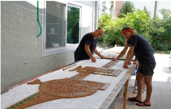
Görüntü 2: Fırınlama sonrası Panonun serme işlemi

Sertleşen panoyu kompozisyon dengesini bozmayacak şekilde, bıçakla ortalama 15x15 cm ya da 20x20 cm ölçülerinde parçalara ayırdık. Panomuz 162 parça olmuştu. Yüksek seyreden hava sıcaklıkları nedeniyle kuruma çok çabuk oluyordu ve ertesi gün parçaların her birinin alt kazıma ve numaralandırma işlemini tamamlayarak kurutmaya aldık. Bir müddet bekledikten sonra kuruyan pano parçalarını gaz yakıtlı fırına yerleştirdik ve 800 derecede bisküvi pişirimini yaptık. Bisküvi pişirimi sonrasında daldırma yöntemiyle parçaları önceden denemeleri yapılan sır içine daldırarak sırlamalarını yaptık. Panoyu tekrar bir araya getirdik. Her bir bölüm içinde yer alan potalı boşluklar içine de mavi ve yeşil cam kırıklarını doldurduk ve fırına yükledik ve 1230 derecede sır pişirimini gerçekleştirdik. Fırınlama sonrası iyi sonuç almıştık. Tasarlanan şekilde toprağı – suyu –doğayı temsil eden renkler tam istenen sonucu vermişti. Mavi camlar tertemiz suyu, yeşil camlar yemyeşil doğayı, kahverengi gövde rengi, korunan – kirletilmemiş toprağın rengini yansıtıyordu.