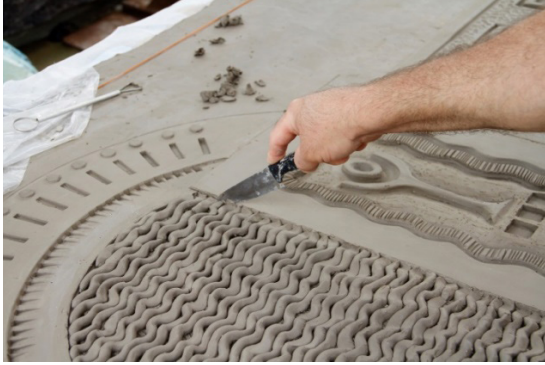
Görüntü 1: Panonun kesim aşaması

içindeki alçak yüzeyleri belirledik, kazıma işlemlerini tamamladık, iç kısımlarında istediğimiz potalı alanlar için ahşap baskı elemanlarını hazırladık ve onlarla kil yüzeyine bastırarak renkli camlar kullanacağımız alanları hazırladık, bezeme işlemlerini bitirdik. Bütünün şekillendirmesi ve rötuşundan sonra biraz sertleşmesi için beklemeye geçtik.