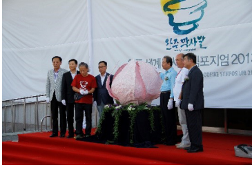
Görüntü 7: Açılış Töreni

Bu çalışma benim için KKTC Yakın Doğu Üniversitesi merkez kütüphane duvarına yaptığım "Özgürlük" isimli çalışmamdan sonra ikinci yurtdışı deneyimim olmuştu. Macsabal Müzesi ve panonun açılışı, seramik sempozyumu sergisinin açılışı Kore geleneklerine göre oluşturulan muhteşem bir açılış töreni ile yapıldı. Müze girişinin olduğu binanın tamamı beyaz bir örtü ile kaplanmıştı. Yaklaşık 15 metre uzunluğunda altı şeritten oluşan ipler ben ve şehir üst düzey yöneticilerinden oluşan 6 kişi tarafından bir anons sonrası açılmıştı. İzleyen halkın büyük alkışlarıyla önce pano ortaya çıkmış, büyük alkış almış ve sonrasında müze açılmıştı. Çok keyif aldım, büyük gurur duydum.