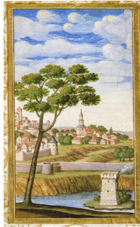
Resim 1: Divan-ı İlhami'den Osmanlı minyatüründe bir peyzaj örneği.

Türk minyatür sanatı Uygurlardan 19. yüzyıla kadar geçen sürede çeşitli devletler bünyesinde, farklı coğrafyalar içerisinde devamlı değişerek, kendini geliştirip yenilenmiştir. Fakat genle bakıldığında minyatür konuları dört ana başlığa ayrılabilir. Resmedilen minyatürler; Olayları hikâye edenler, Peyzajlar, Portreler ve Bilimsel konular (Elmas,2000:28) olmak üzere dört konu üzerinde yoğunlaşmıştır.