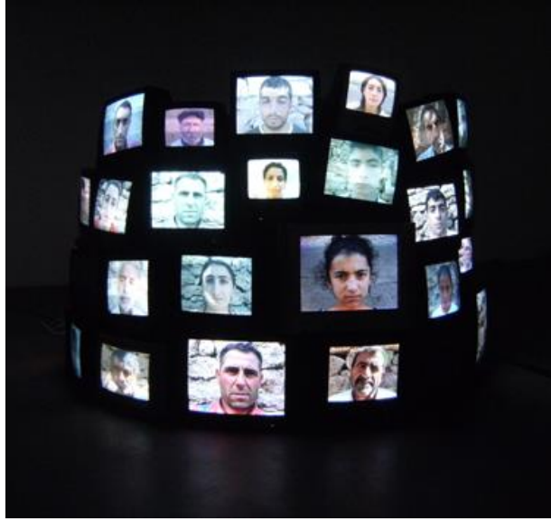
Resim Kutluğ Ataman, “Kule”, 2009.

Halil Altındere'nin My Mother Likes Pop Art, Because Pop Art is Colorful (1998) (Resim 3) adlı çalışmasında toplumsal değişimi ve karşıtlıkları sanatçının kendisi üzerinden izleriz. Eserin adından anlaşılacağı üzere resimdeki rengârenk minderde oturmuş, elindeki sanat kitabına bakan yaşlı kadın sanatçının annesidir. Sanatçı ile ailesi arasındaki sosyo-kültürel mesafeyi, annenin hoşgörüsünü ve sanatçının yeni habitusunu göstermektedir. Ellis ve Holman Jones'a göre kültürel deneyimi anlamak amacıyla temel veri olarak araştırmacının “kendisini” yerleştirdiği kişisel anlatı olan otoetnografi sosyal bir bağlam içinde sistematik olarak araştırma ve yazma yaklaşımıdır (Ellis vd. 2011: 1). Altındere'nin bu sanatsal ifadesini etnografik bir form olan otoetnografi olarak görmek mümkündür.