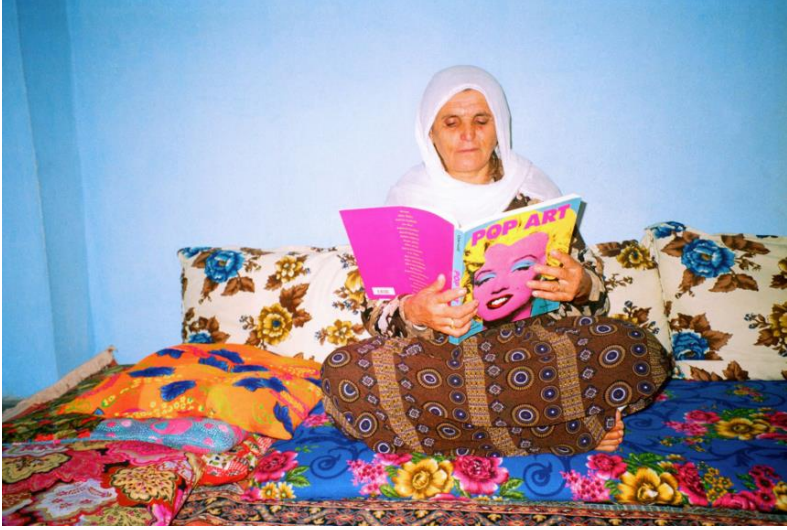
Resim 3. Halil Altındere, “My Mother Likes Pop Art, Because Pop Art is Colorful”, 1998.