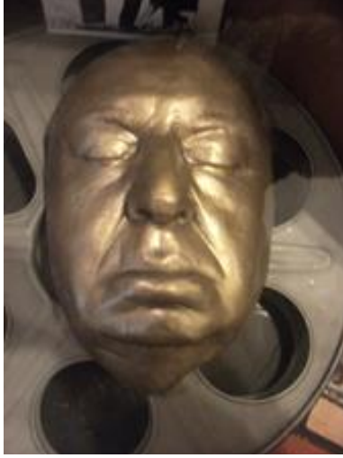
Fotoğraf 2: San Juan Bautista müzesinde sergilenen Alfred Hitchcock'un post mortem maskesi.

Napoleon Bonaparte, Frederic Chopin, Leo Tolstoy, Ludwig van Beethoven, Victor Hugo, Frederic Nietzsche, Alfred Hitchcock, Bruce Lee gibi bir çok kişinin post mortem maskesi yapılmıştır (Lindsay 23-24).