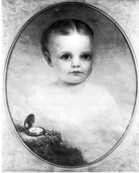
Fotoğraf 4: Fotoğrafın icadı sonrası Post Mortem Resim Örneği, Shepard Alonzo Mount, Camille'nin Portresi, 1868.

akmaktaydı ve sık sık geniş kitleleri etkisi altına alan kolera ve tifüs salgınları çıkmaktaydı.