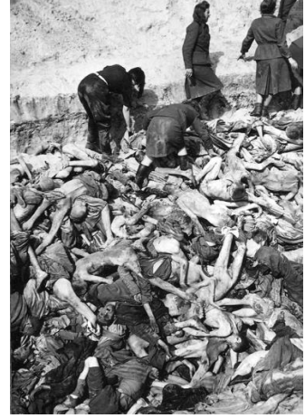
Fotoğraf 2: George Rodger tarafından çekilmiş Bergen-Belsen Toplama Kampında Esirlerin Cesetlerin Fotoğrafi, 1945.