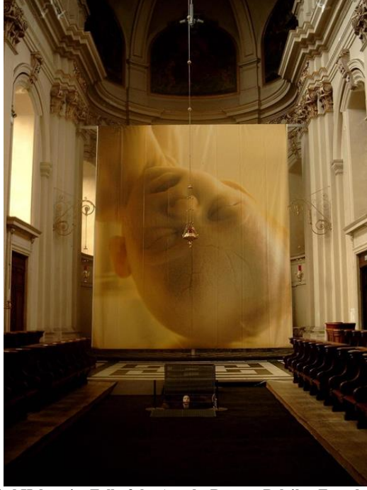
Fotoğraf 11: Gottfried Helnwein, Fall of the Angels, Bruges, Belçika, Enstalasyon, 1000 x 700 cm, 2005.