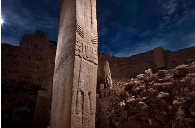
Fotoğraf 1: Göbekli Tepe’deki T biçimi sütunların üzerine eller, kemer ve peştamallar yontularak stilize edilmiş bir insan figürü.

Latince “post” (ardında, arkasında, sonra) ve “mors” (ölüm, ceset) (Kabağaç ve Alova 374,458) kavramlarından türetilmiş olan post mortem fotoğraf, temel olarak ölü veya ceset fotoğrafçılığı olarak tanımlanabilmektedir. Günümüz bakış açısından değerlendirdiğimiz zaman oldukça sıra dışı olarak görülmesine rağmen ölüyü / atayı anma bağlamında ele alındığı takdirde neredeyse insanlık tarihi kadar eski bir ritüelin son halkalarından birisidir. Günümüze kadar ulaşabilmiş antik veya daha eski dönemlere ait yapıtlar incelendiğinde bir çoğu ölüm kavramıyla ilintilidir. Bilinen en eski yapılardan olan Şanlıurfa Göbekli Tepe tapınağı, İngiltere’de bulunan Stonehenge ve Mısır piramitleri ölüm ve sonrasıyla ilişkilidir.