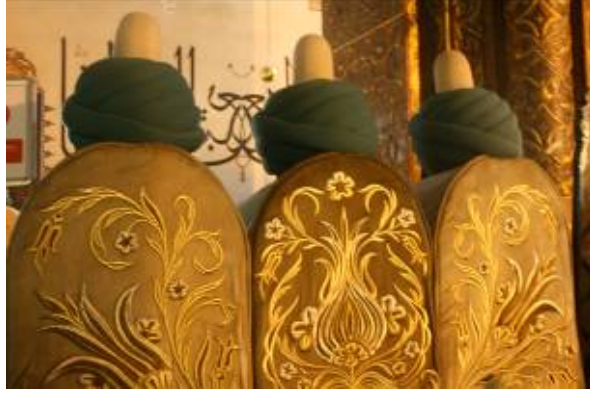
Destarlı sanduka sikkeleri (Mevlâna Müzesi)