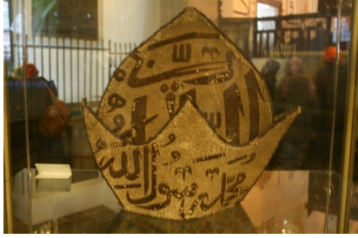
İşlemeli serpuş (Mevlâna Müzesi)