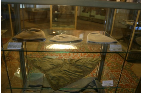
Mevlâna Müzesi’nde sergilenen sikke ve arakiyeler