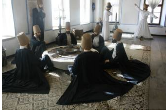
Dal sikkeli dervişler (Mevlâna Müzesi)