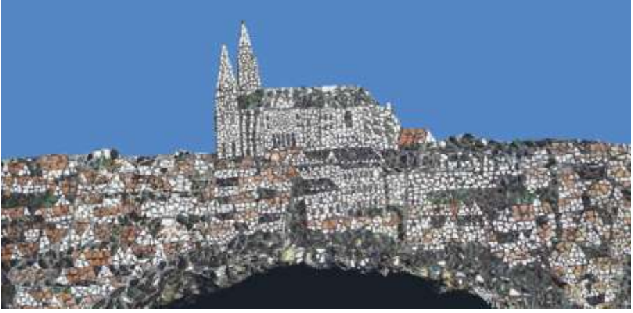
Resim 9 : Chartres Kenti Betimlemesi, Siyah Avlu