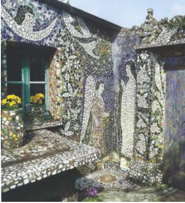
Resim 11 : Meryem'e Müjde Sahnesi