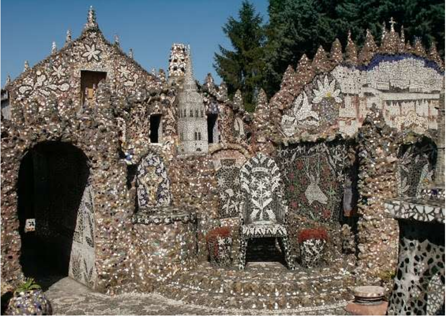
Resim 10 : Siyah Taht, Siyah Avlu

( http://matinlumineux.blogspot.com/2011/06/maison-picassiette-chartres.html )