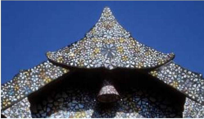
Resim 3: Çatı Saçakları