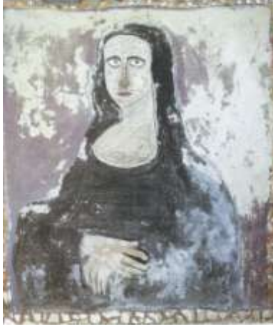
Resim 13: Mona Lisa Betimlemesi