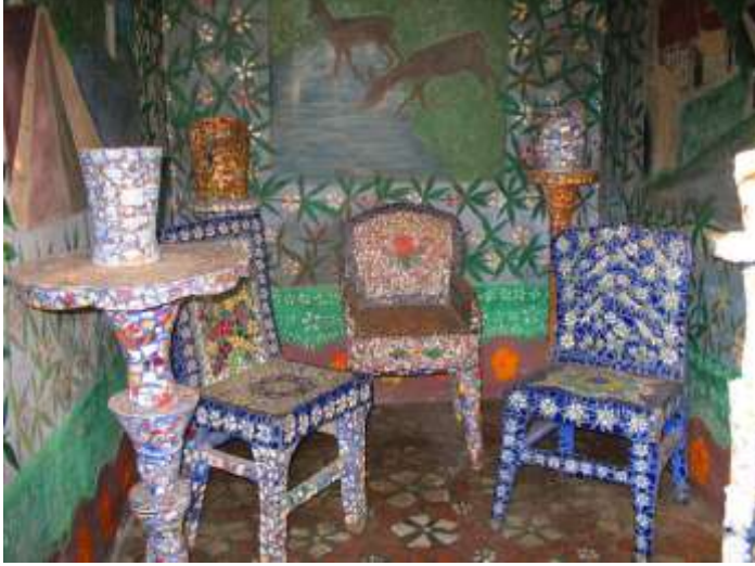
Resim 5: Küçük Salon

Küçük Salon veya kış bahçesi olarak adlandırılan oda, evin en dar odasıdır. Taban ve mobilyalar mozaikle kaplıdır. Duvarlarda ise freskler bulunmaktadır. Girişin karşısındaki duvarda, çaydan su içen ceylanları gösteren natüralist bir betimleme varken sağ duvarda ise Chartres kenti ve kentin içinden geçen Eure nehri betimlenmiştir. Odada bitkisel motifler yoğun olarak işlenmiştir (Resim 5).