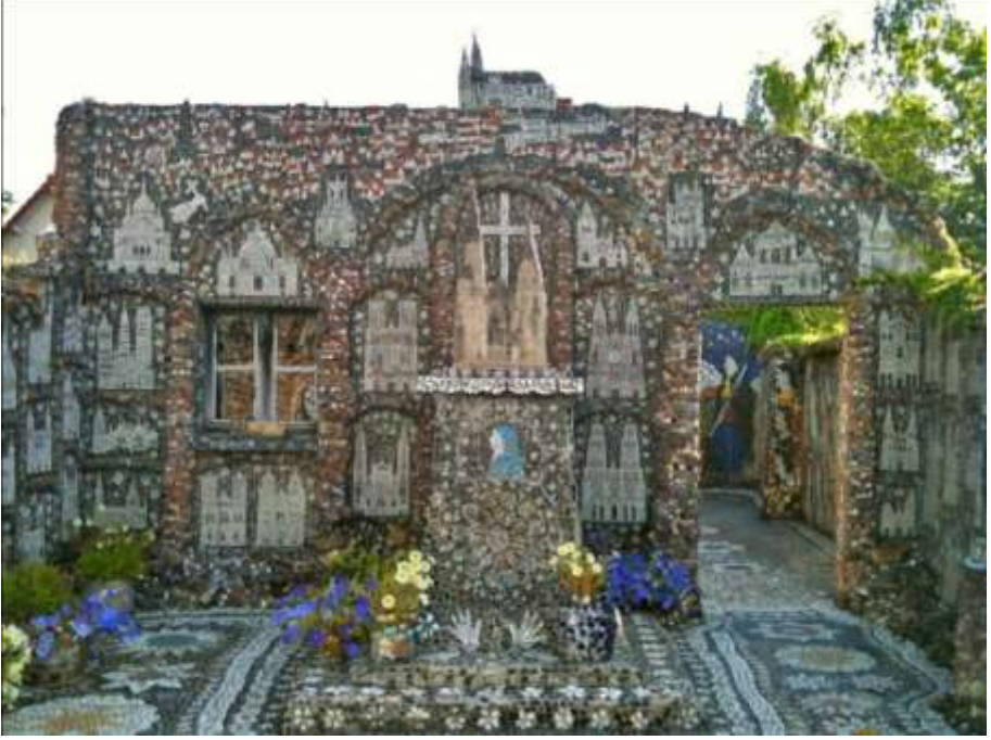
Resim 8: Siyah Avlu

Chartres katedrali ve altında da kırmızı çatılı Chartres evlerinin betimlemeleri görülmektedir (Resim 8, 9). Avlunun yan duvarlarında günlük yaşamdan kesitler bulunmaktadır. Bu panolarda hayvan ve insan figürleri ve bitkisel motifler yer almaktadır. Güneye bakan soldaki duvarın merkezinde, şapelde de görülen bir kadın, çoban ve köpeğinin tasviri vardır. Köpek figürü Isidore için sadakati temsil etmektedir. (Valles-Bled 2007: 17)