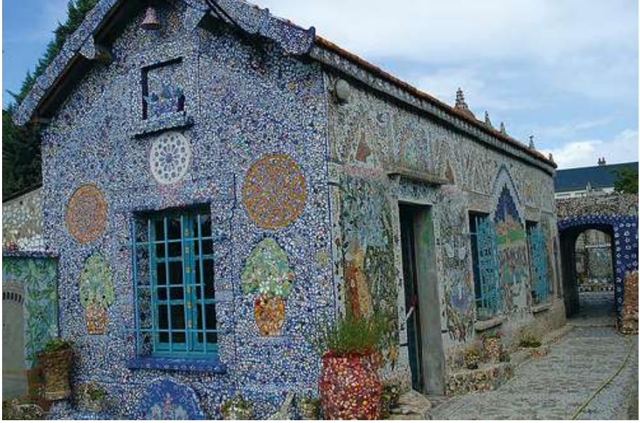
Resim 2 : Picassiette Evi Ön Cephe

( http://www.thedailytelecraft.com/2012/07/field-trip-maison-picassiette.html )