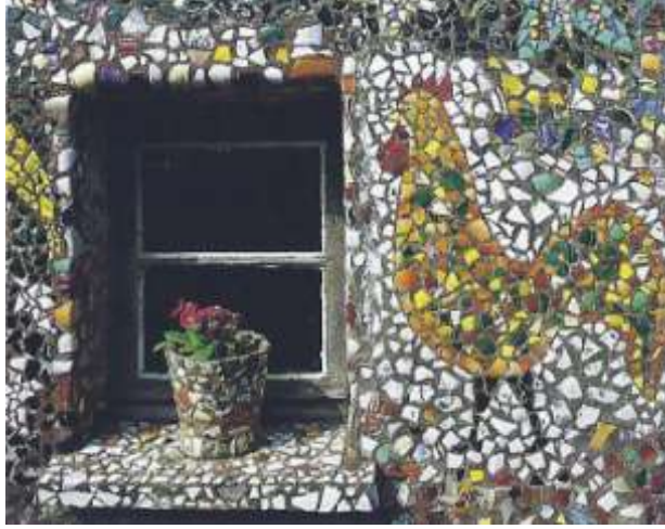
Resim 2: Horoz Figürü