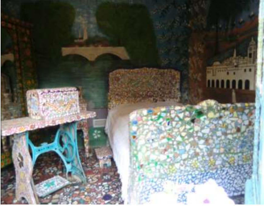
Resim 6 : Yatak Odası

( http://ailonuage.canalblog.com/tag/Musées )