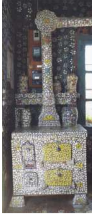
Resim 4 : Mozaik Kaplı Ocak ve Fırın

Mutfak, aynı zamanda yemek ve oturma odası olarak da kullanılmıştır. Mutfakta, girişin karşısındaki ana duvarda Fransa'nın güneydoğusunda bir manastır kompleksi olan Mont Saint Michel betimlemesi vardır. Fresk olarak yapılan bu betimlemenin etrafında bitkisel motifler bulunmaktadır. Ocak ve bacası, masa, sandalyeler, dolap ve taban tamamen mozaikle kaplıdır. Ancak bu kaplamalar objelerin işlevlerini engellememektedir (Resim 4). Tavanda ise büyük bir çiçek resmi bulunmaktadır.