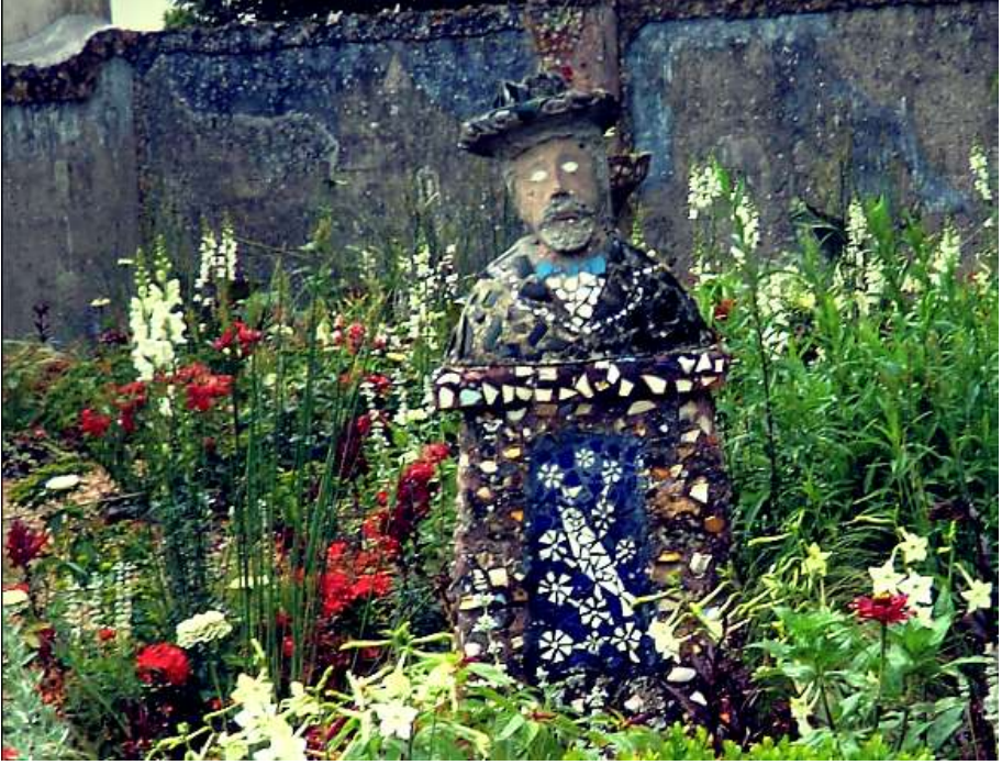
Resim 14 : Pasteur Büstü, Heykelli Bahçe

( http://ailonuage.canalblog.com/tag/Musées )