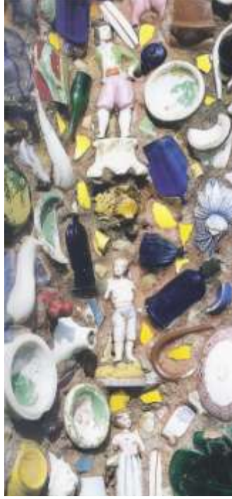
Resim 12 : Yazlık Ev Detay