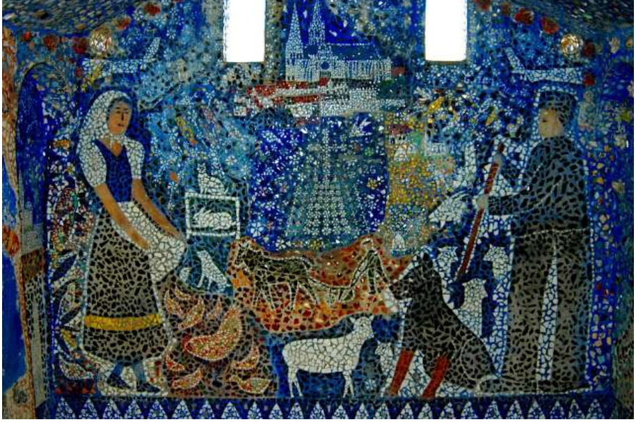
Resim 7: Chartres Kenti Betimlemesi

( http://matinlumineux.blogspot.com/2011/06/maison-picassiette-chartres.html )