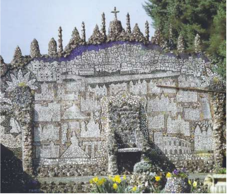
Resim 15 : Kudüs Duvarı