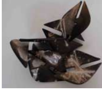
Şekil 9: Bağlıym, bağlısın, bağlı, III Ölçü: 65x40x25 Teknik: Raku, Kalıpla Şekillendirme