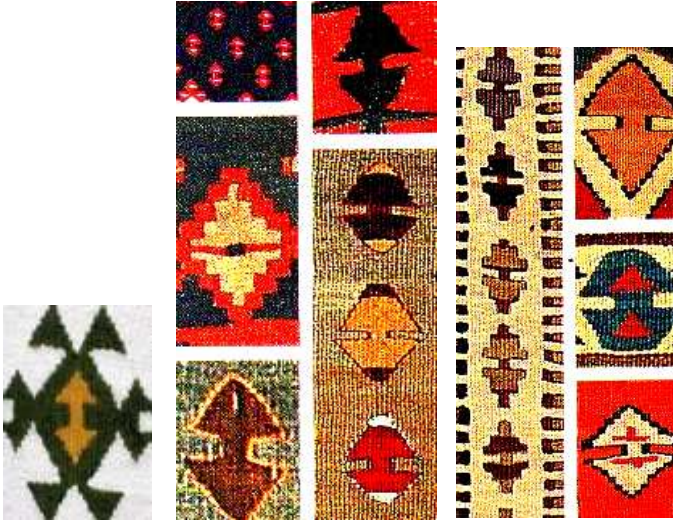
Şekil 2: Bukağı Kilim Motifleri

http://www.haliyikama.biz.tr/hali-motifleri/bukagi-motifleri.html 3.06.2011