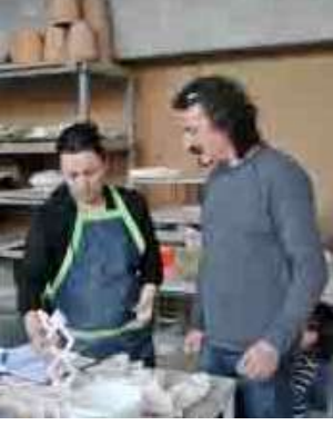
Şekil 3: Atölye Çalışması