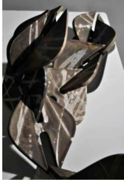
Şekil 8: Bağlıyım, bağlısın, bağlı Ölçü: 65x55x 40 Teknik: Raku Pişirimi.