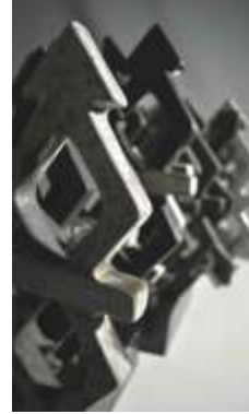
Şekil 11: Bağlıym Ölçü: 45x70x30 Teknik: Raku, Kalıpta Şekillendirme