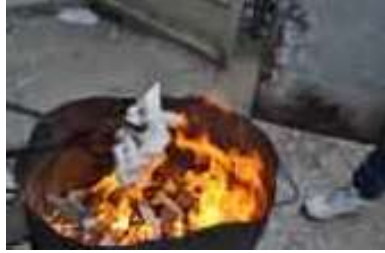
Şekil 5: Seramikler Talaşın İçine Atılıp Redüksiyon Yapılma Aşaması.