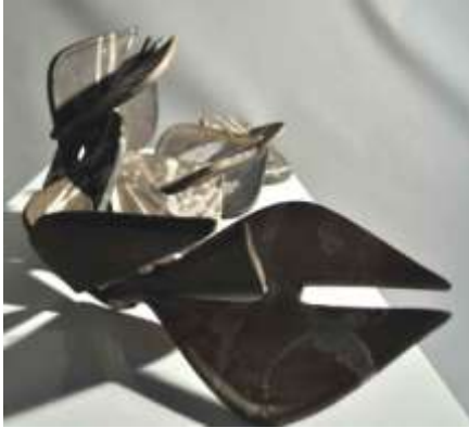
Şekil 7: Bağlıyım, bağlısın, bağlı I Ölçü: 50x40x25 Teknik: Raku, Kalıpla Şekillendirme

Bağlılık kavramı bu yüzyılda çok fazla konuşulan bir kavramdır. Sonsuza kadar birliktelik fikri bugün pek çok insan için mümkün olamayacak bir durum olarak yorumlanabilir. “Bağlıyım bağlısın bağlı” isimli seramik çalışmasında kadınların dünyaya baktığı pencereden bahsediliyor. Bu bakış biçimi kendi içinde çelişkileri de barındırıyor. Aynı siyah ve beyazın bir biri içinde barındırdığı kesin ayırım gibi. Bağlılık kavramı çelişkiler yumağı ile örülmüş bir kavram. Bukağı motifinin seramik yorumunda bir birinden bağımsız olması aslında hareket özgürlüğü kazandırdığı gibi aslında hareketide zorlaştırmaktadır. İstedğimiz parçayı ekleyip çıkararak formlarda değişiklikler yapabiliriz. Bu da bize hayatta yapmayı düşlediğimiz değişiklikleri hatırlatmaktadır. Yada kaçmak istediğimiz ama kaçamadıklarımızı. Çünkü parçalardan birileri eksildimi tek başına ayakta durmaları mümkün değildir. Aslında çelişkide burada başlamaktadır.