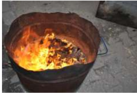
Şekil 6: Seramiklerin Talaşın İçine Redüksiyonları Yapılırken.