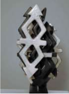
Şekil 10: Bağlısın Ölçü: 35x40x50 Teknik: Raku, Kalıpla şekillendirme