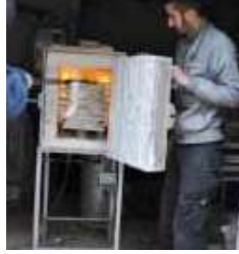
Şekil 4: Raku Fırını Yanarken